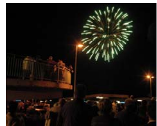
Abschluss 30.7., 22.30 Uhr: Brilliant-Feuerwerk