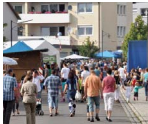
29./30.7.: Festmeile in der Bahnhof- und Hauptstraße