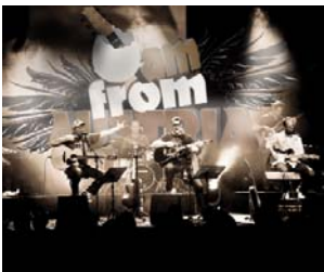
Auftakt 27.7., Sportarena: I am from Austria